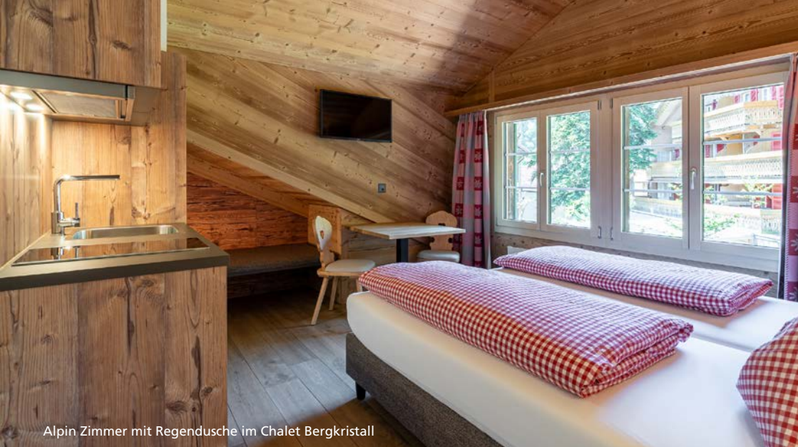
Alpin Zimmer mit Regendusche im Chalet Bergkristall